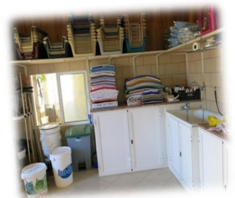
Lagerraum und gleichzeitig Hundebad, hier werden sie vor Abreise schick gemacht.