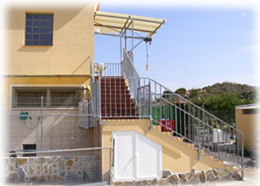
Aufgang zur Katzenquarantäne