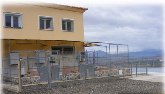
Die Hundequarantäne, bestehend aus 7Boxen, 4 davon mit Auslauf nach draussen.