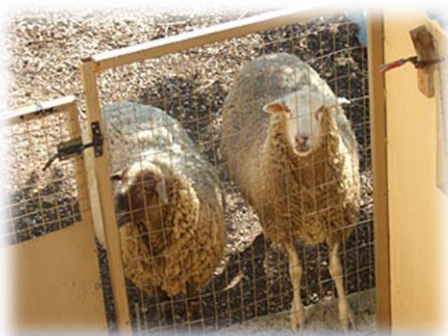
Der Stall für die Schafe