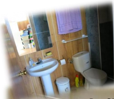
Dusche und WC für Gäste.