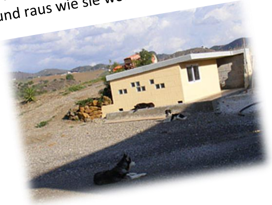
Das Häuschen unserer Hunde die Dauergäste sind. Da können sie rein und raus wie sie wollen.