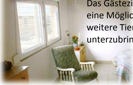
Das Gästezimmer oder eine Möglichkeit 2 weitere Tierärzte unterzubringen.