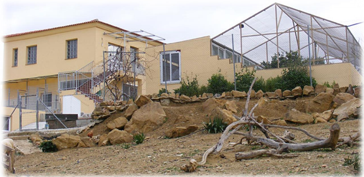
Sichtbar ein Teil des Haupthauses und das Katzenhaus von hinten. Die Freifläche ist für wilde Katzen (alle kastriert) und unsere zwei Schafe.