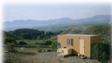
Futter- und Schlafplatz für die wilden Katzen, durch das Fenster können sie jederzeit rein und raus