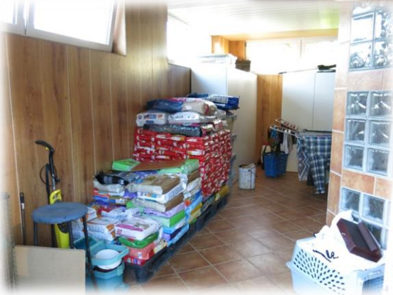
Der Lagerraum für Futter, Tierärztebedarf und vieles mehr.