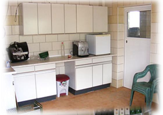
Das Büro und gleichzeitig Behandlungsraum mit direktem Zugang zur Hundequarantäne